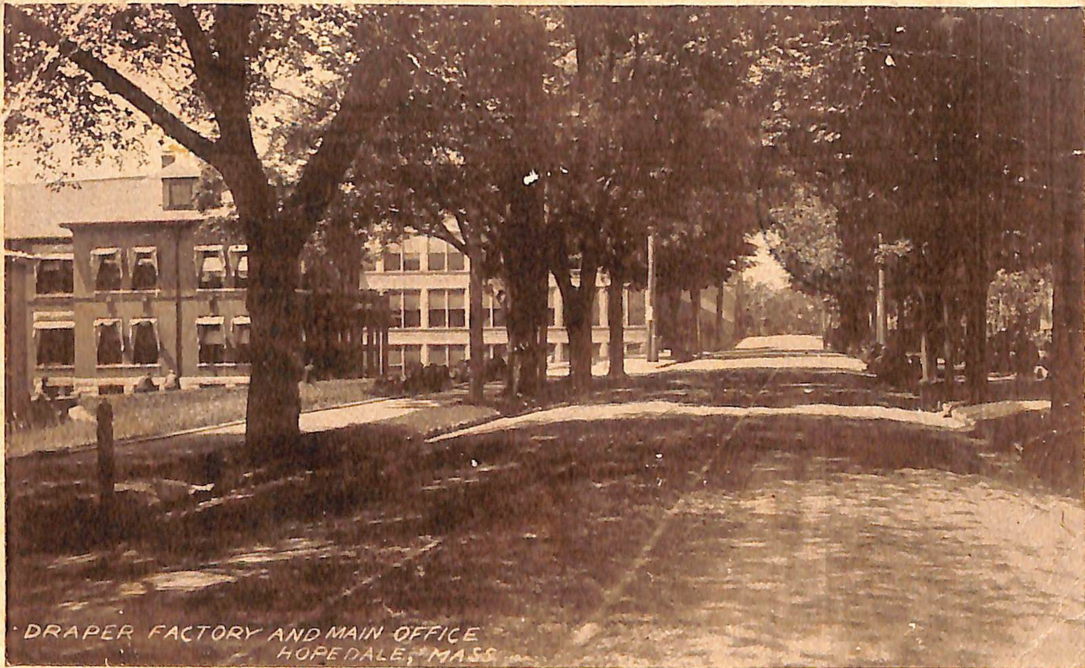
DRAPER FACTORY AND MAIN OFFICE HOPE DALE, MASS.